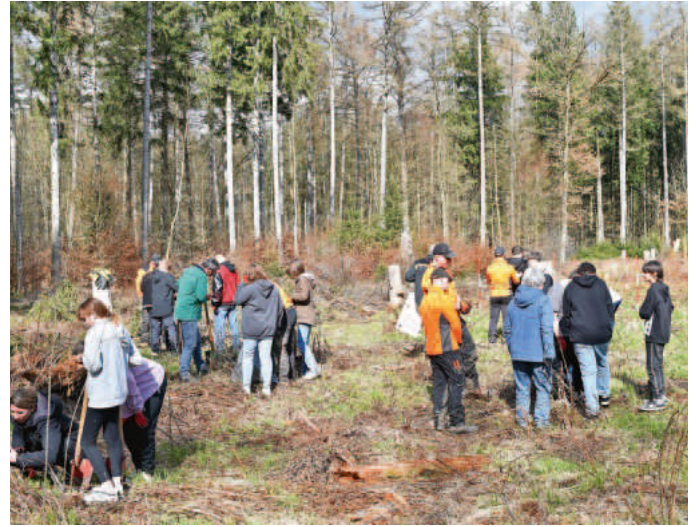
Die Jugendlichen und Erwachsenen bei der Baumpflanzaktion.

Die Schülerinnen und Schüler vertrauten derweil den Angaben der Profis und stellten sich mit ihren Pflanzen in die entsprechenden Reihen und machten sich tatkräftig an die Arbeit.